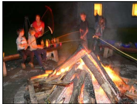
5 Tage im Hühnerhof Gemeinsam Spielen, Singen, Spaß haben – und die Welt entdecken