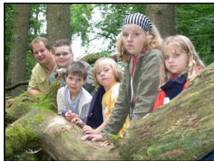
„Wilde Kerle“ im Wald