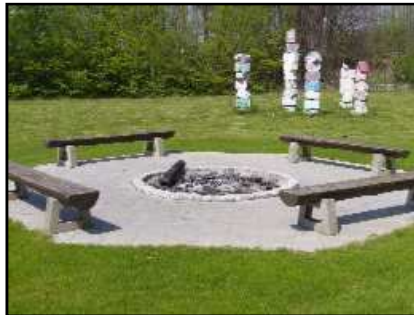
Der Lagerfeuerplatz mit Indianer-Totempfählen