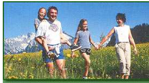
Tolle Erlebnisse mit der ganzen Familie