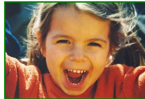
Gemeinsam Spielen, Singen und Spass haben