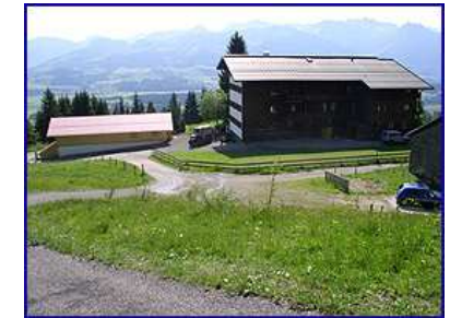
Bergluft schnuppern auf der „Kahrückenalpe“